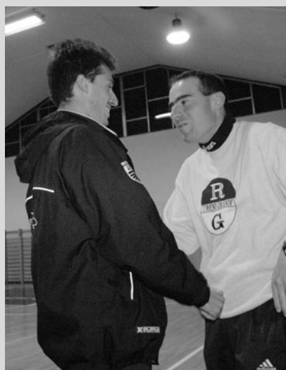
Patto tra capitani... che non serve a fermare i Livignasc...